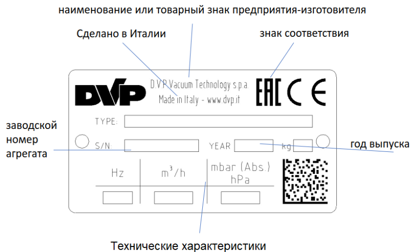
Рисунок 2. Маркировка

Все насосы имеют таблички с названием и адресом производителя, маркировкой сертификации Евросоюза и техническими параметрами самого насоса.